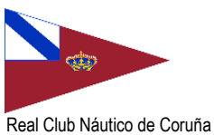
Real Club Náutico de Coruña